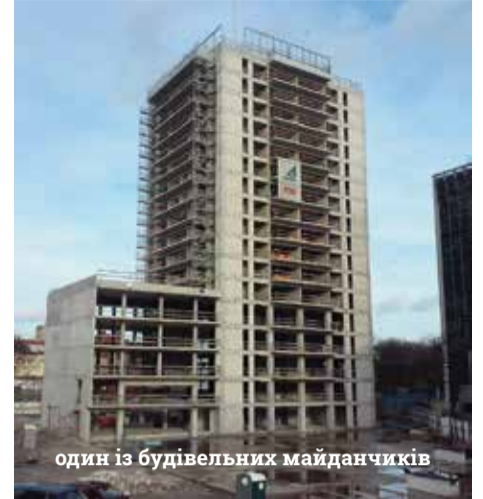
один із будівельних майданчиків