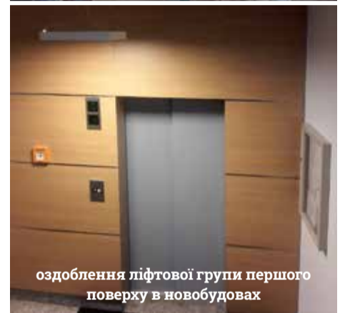
оздоблення ліфтової групи першого поверху в новобудовах