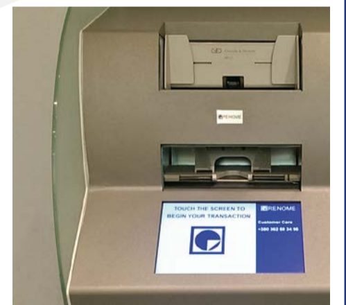
Електронний сейф ES 3001 виробництва ТОВ «РЕНОМЕ-СМАРТ»