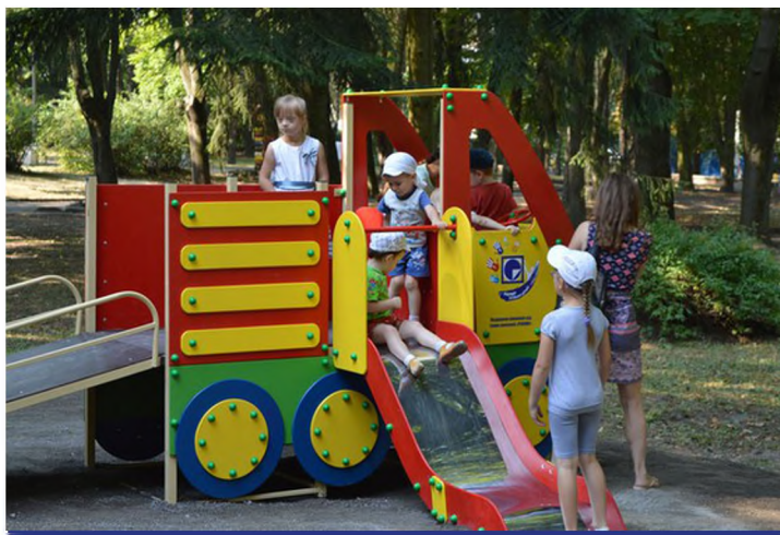
Ігровий майданчик для дітей з особливими потребами. Парк культури та відпочинку ім.Т Шевченкам.Рівне

Радіють ігровому майданчику й батьки особливих дітей, а малеча з задоволенням випробовує нові ігрові елементи. За