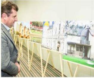
4 грудня 2014 р., компанія «РЕНОМЕ-ПАРТНЕР» брала участь у щорічній конференції для компаній-партнерів